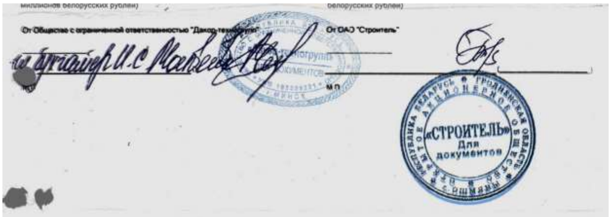
Фото № 4. Вид наложения реквизитов в сравниваемых документах.

Примечание: цифрами, стрелками и контурными линиями, выполненными красящим веществом зеленого цвета, отмечены диагностические признаки печатного текста.